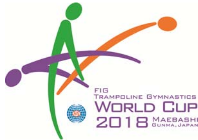
「ワールドカップロゴ」